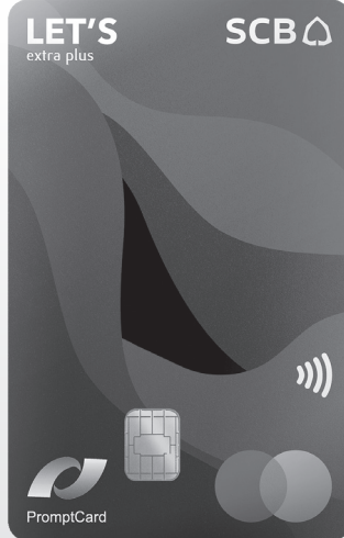
บัตรเดบิต เล็ทส์ เอสซีบี เอ็กซ์ตราพลัส “LET'S SCB EXTRA PLUS Debit Card”