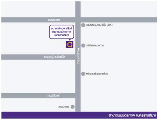
สาขานนทบุรี (นครราชสีมา)

ธุรกิจต่างประเทศ ชั้น 3 อาคารไทยพาณิชย์ จำกัด (มหาชน) สาขานนทบุรี (นครราชสีมา) เลขที่ 541/1 ต.ในเมือง อ.เมือง จ.นครราชสีมา 30000