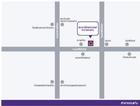
สาขาขอนแก่น

ห้องประชุม ชั้น 3 อาคารไทยพาณิชย์ จำกัด (มหาชน) สาขาขอนแก่น เลขที่ 491 ด.ศรีจันทร์ ต.ในเมือง อ.เมือง จ.ขอนแก่น 40000