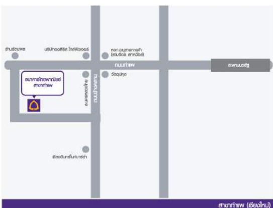
สาขาท่าแพ (เชียงใหม่)

ห้องฝึกอบรม ชั้น 3 อาคารไทยพาณิชย์ จำกัด (มหาชน) สาขาท่าแพ (เชียงใหม่) เลขที่ 17 ท่าแพ ต.ช้างค้ำ อ.เมือง จ.เชียงใหม่ 50000