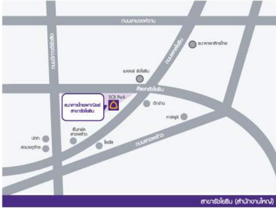
สาขาวิจัย (สำนักงานใหญ่)

ห้องฝึกอบรม ตึก Tower D Plaza East ห้องแก้วใหม่ ชั้น 5 อาคารไทยพาณิชย์ จำกัด (มหาชน) สำนักงานใหญ่ เลขที่ 9 อ.รัชดาภิเษก แขวงจตุจักร เขตจตุจักร กทม. 10900