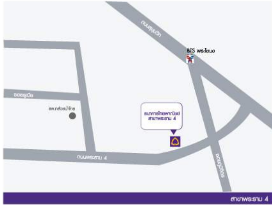
สาขาพระราม 4

ศูนย์อบรมสาขาพระราม 4 (กรุงเทพฯ) ชั้น 3 อาคารไทยพาณิชย์ จำกัด (มหาชน) สาขาพระราม 4 เลขที่ 4796/8 ถนนพระราม 4 แขวงพระโขนง เขตคลองเตย กทม. 10110