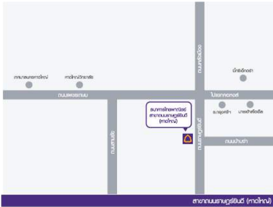
สาขานนทบุรี (หาดใหญ่)

ห้องประชุม ชั้น 5 อาคารไทยพาณิชย์ จำกัด (มหาชน) สาขานนทบุรี (หาดใหญ่) เลขที่ 16/4 ด.ราษฎร์อินดี ต.คอหงส์ อ.หาดใหญ่ จ.สงขลา 90110